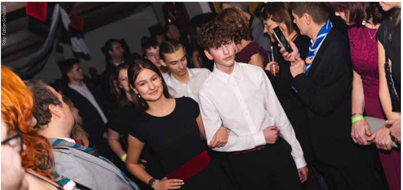
Alle Fotos der Ballnacht auf www.pfadfinder-markersdorf.at .

„Alles Walzer“ hieß es am 5. Jänner beim traditionellen Ball der Pfadfinder und Pfadfinderinnen Markersdorf. Im sehr gut besuchtem und zum Thema festlich geschmückten Gasthaus Dangl in Wimpassing wurde unter dem Motto „Casino Royale“ bis in die Nacht hinein gefeiert.