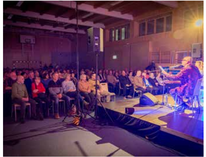
Rund 200 Besucherinnen und Besucher im Turnsaal der Volksschule, beim Kabarett der Volkspartei Markersdorf-Haindorf.