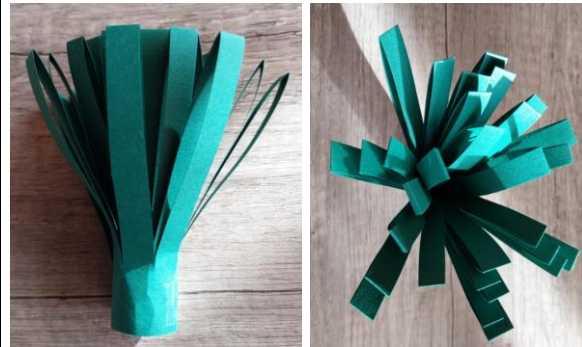
Ansicht von oben

5 Sobald du das Ende fixiert hast, sollte dein Blumengruß etwa so aussehen.